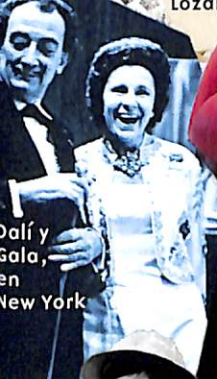
Dalí y Gala, en New York