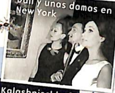
Dalí y unas damas en New York