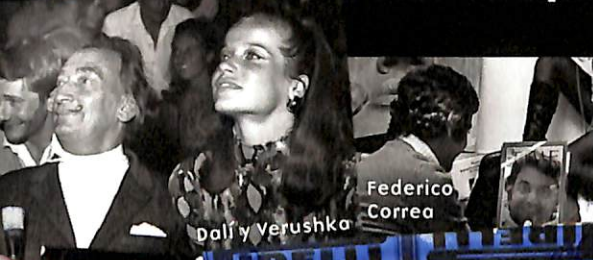
Dalí y Verushka