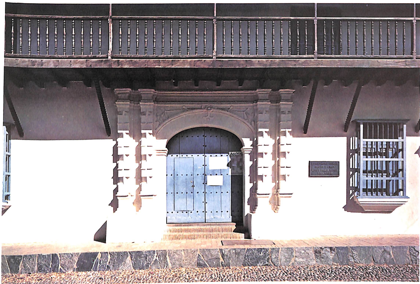
FIG. 671. —Detalle de la fachada. — Casa Arcaya. Coro (Venezuela). — Foto Gasparini